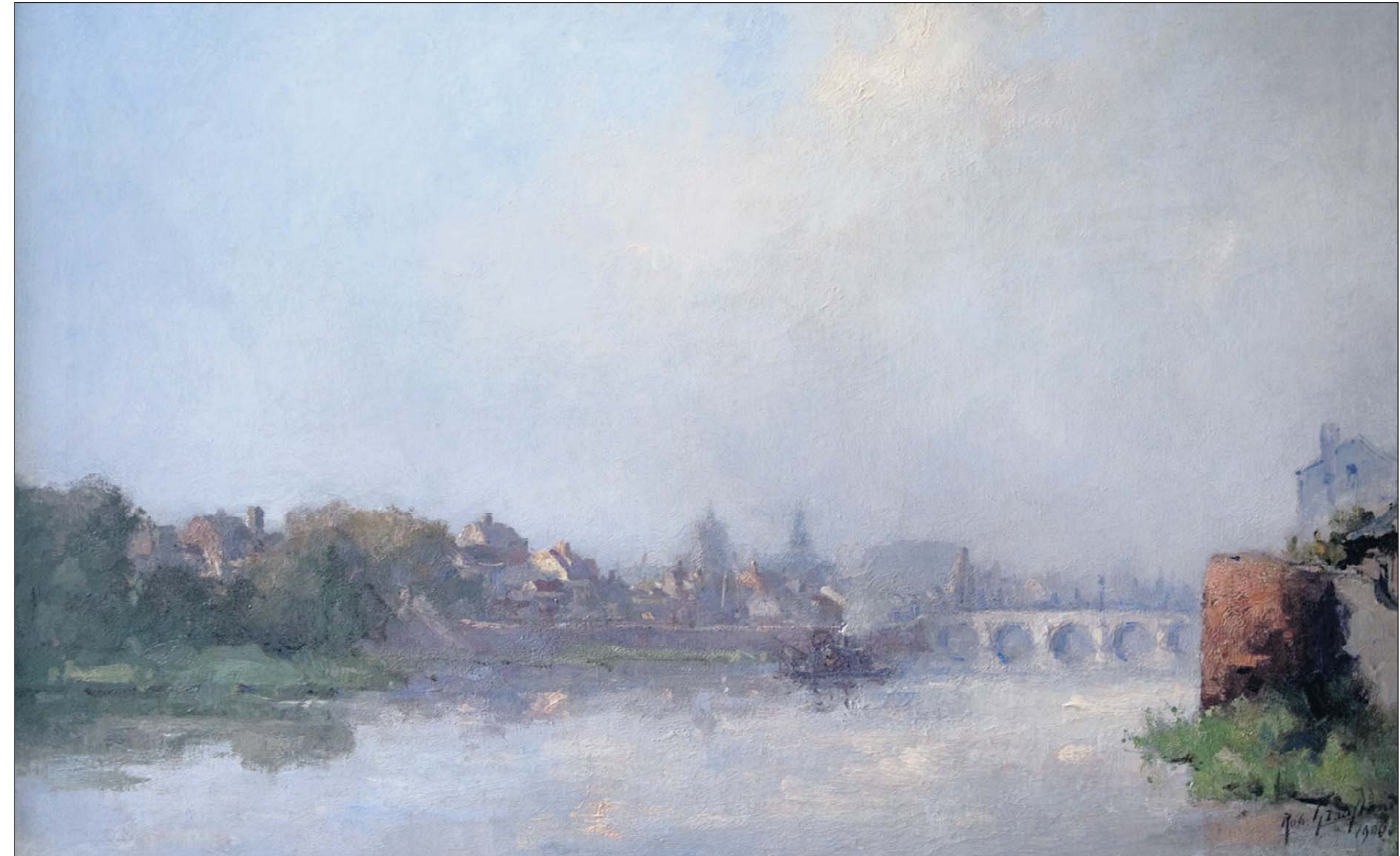
Mei. Het schilderij blijkt veel lichter dan verwacht, met allerlei blauw- en paartinten die domineren.